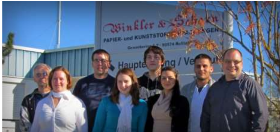
Unsere Azubis 2013 mit den Ausbildern

Diese Stelle ist explizit ethnisch neutral, geschlechts- und altersneutral ausgeschrieben und für schwerbehinderte Bewerber offen..