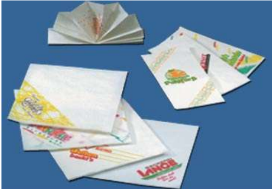
Servietten Ein- und Mehrweggeschirr