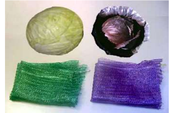
Gemüsesäcke Außer Haus- Verpackungen