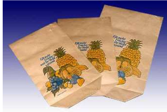
Beutel und Tüten für alle Branchen Hygienepapiere