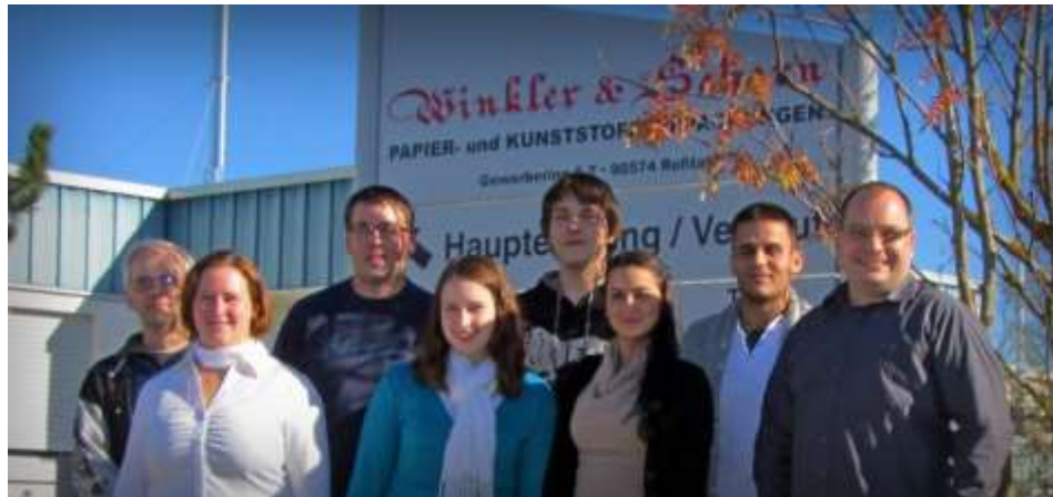
Unsere Azubis 2013 mit den Ausbildern

Diese Stelle ist explizit ethnisch neutral, geschlechts- und altersneutral ausgeschrieben und für schwerbehinderte Bewerber offen..